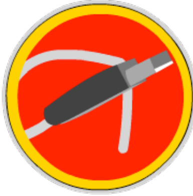
Este lado va conectado al puerto USB de tu computador