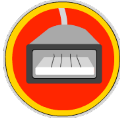
En este conector enchufas tu pendrive o cualquier otro dispositivo USB