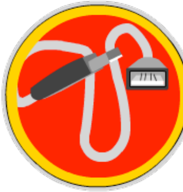
Cable de extensión USB